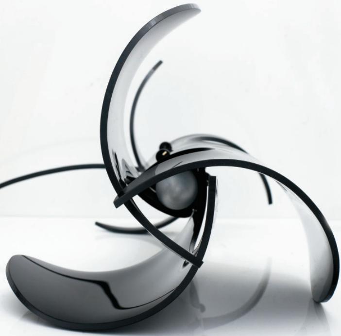
PROP TABLE LAMP STEVE WATSON