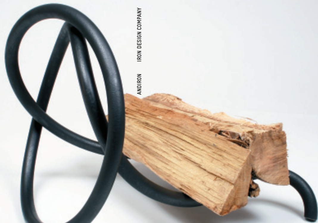
ANDIRON IRON DESIGN COMPANY