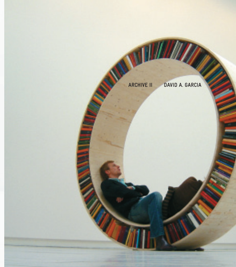
ARCHIVE II DAVID A. GARCIA