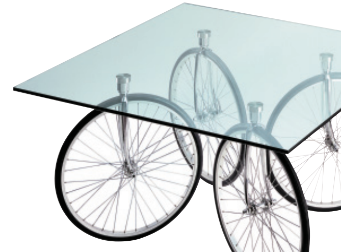
TOUR TABLE GAE AULENTI, FONTANA ARTE